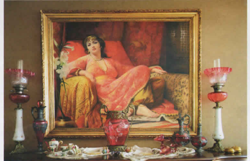
Yağlıboya Safiye Sultan tablosu Kadıköy Moda'daki antikacıardan alınmış. Dresuar üzerine 150 yıllık antika işlemeli havlu serisi. Üzerinde opalin gaz lambaları, opalin şişeler ile Fransız şarap ve su karafaları bulunuyor.