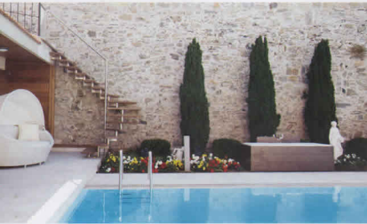
Bahçe mobilyaları Rivelli. Bahçedeki heykeller Euroflora'dan.