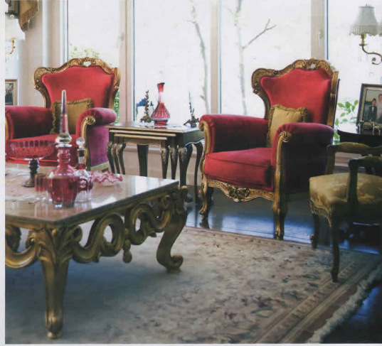
Koltuklar ve berjerler, Odeion Mimarlık'tan. Orta sehpa Vardar Mobilya'dan el yapımı.

"Porselen ve cam tasarlıyorum. Tabii ki pek çok şeyden besleniyorum. Sadece bir seramik sanatçısı değilim. Aynı zamanda yaptığı ürünleri hayata geçirip satmak zorunda olan bir fabrikada çalışıyorum."